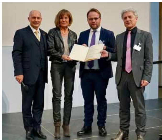
Rainer Bomba (Staatssekretär für digitale Infrastruktur) übergibt Esther Dilcher und Timon Gremmels sowie dem Breitbandkordinator des Landkreises Kassel, Harald Birsl, den Förderbescheid.

Der Bund fördere mit der Bewilligung 50 Prozent des gesamten Fördervolumens des Ausbauprojektes in Höhe von 8,75 Millionen Euro für eine flächendeckende Internetversorgung mit 30 Megabit in der Sekunde (Mbit/s) für 11 kreisangehörige Kommunen mit 23 Ortsteilen und 56 Schulen. Es handele sich um Ahnatal, Fuldabrück, Helsa, Niestetal und Vellmar aus dem Wahlkreis Kassel und Baunatal, Wolfhagen, Naumburg, Zierenberg, Bad Emstal und Schauenburg aus dem Wahlkreis Waldeck. Für die Schulen solle eine Glasfaserverbindung bis zu den einzelnen Klassen- und Lehrerzimmern realisiert werden. Bei einer in Aussicht gestellten zusätzlichen Komplementärfinanzierung durch das Land Hessen von